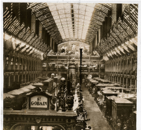
Plaquette de verre stéréoscopique présentant l'intérieur du palais de l'Industrie

Les plus grands industriels du pays sont donc venus exposer leurs innovations dans le palais de l'Industrie. Érigé pour l'occasion, celui-ci est en soi une prouesse technique : ce gigantesque édifice est presque tout entier fait de fer et de verre. Naturellement, il a fallu pour cela l'aide d'un fabricant à la hauteur... La société Saint-Gobain, forte de ses 2 000 employés et d'un savoir-faire à la pointe, a pris en charge cette commande hors norme : 6 500 mètres de glace !