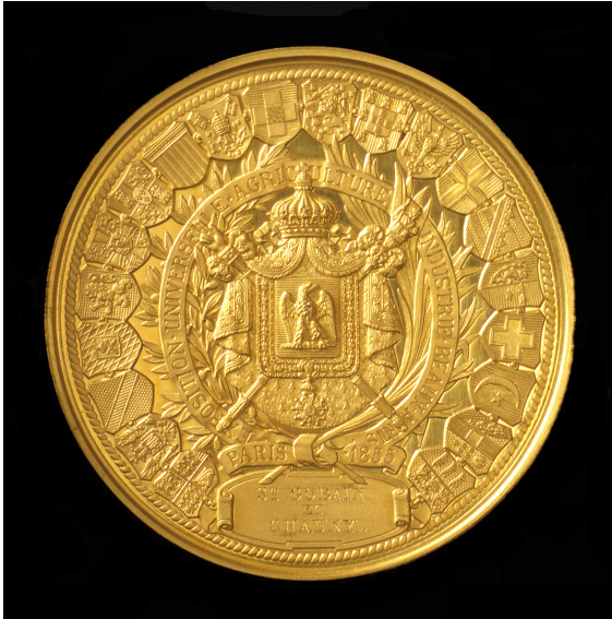
Médaille d'or de l'Exposition universelle de Paris en 1855 décernée à Saint-Gobain

Le jury la remarque d'ailleurs , puisque Saint-Gobain récolte deux récompenses pour sa participation, dont la grande médaille d'honneur du jury. Depuis, le lauréat ne se repose pas sur ses lauriers. Lors des nombreuses Expositions universelles qui s'ensuivent, Saint-Gobain répond présent à la fois comme exposant et fournisseur. Ce mois de mai 1855 aura inauguré une longue série de podiums pour un des fers de lance de l'industrie française !