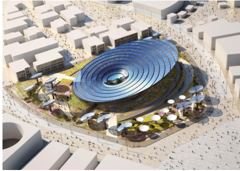
Exposition universelle de 2020 à Dubaï © Grimshaw Architects - Expo 2020 Dubai

Saint-Gobain prend pleinement part aux rencontres internationales de l'industrie. En 2021 et 2022, le Groupe joue un rôle clé lors de l'Exposition universelle 2020 de Dubaï . Grâce à ses solutions innovantes pour concevoir des bâtiments à haute performance, il participe à ériger plus de 60 pavillons !