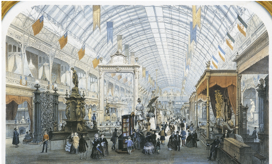
Grande glace de Saint-Gobain présentée à l'intérieur du palais de l'Industrie à Paris en 1855