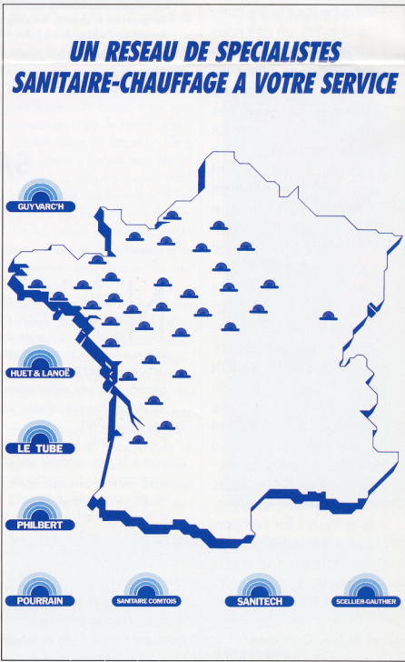
Le réseau des spécialistes sanitaires et chauffage ayant rejoint l'enseigne CEDEO en 1991

L’enjeu est de taille : dispersées, ces entreprises se heurtent à une concurrence très rude et sont en train de perdre du terrain. Fédérées, elles pourraient devenir leader sur le marché des distributeurs français dans les domaines du sanitaire et du chauffage.