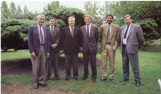
L'équipe dirigeante de CEDEO en 1991

Cette "Opération Sacha" est un succès et permet de fédérer les onze entreprises. Mais ce nom ne sera finalement utilisé qu'en interne : pour baptiser ce regroupement d'enseignes, les PDG opteront pour "CEDEO".