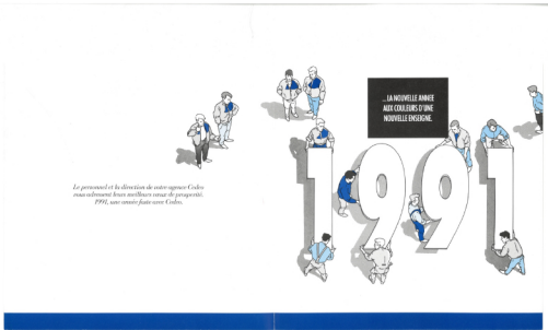
Première carte de vœux réalisée pour le lancement du logo de l'enseigne CEDEO

Et ce nom-là, d'où vient-il ? Tout simplement d'une des onze entreprises. Et si elle a été choisie parmi toutes les autres, c'est parce qu'elle devient la structure d'accueil du regroupement CEDEO, qui naît officiellement le 1er janvier 1991... il y a 30 ans tout pile !