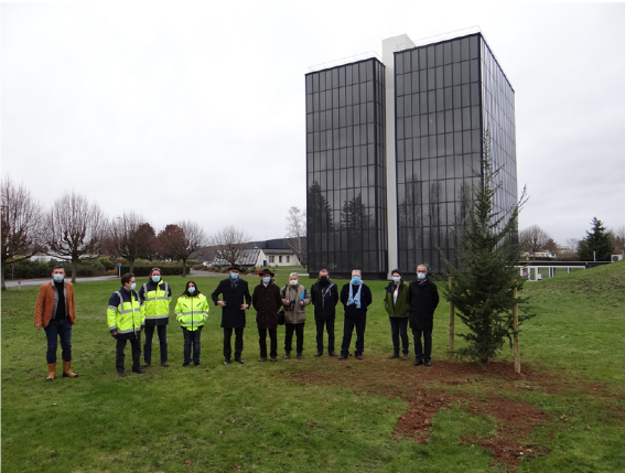
Le cèdre du Liban dans le parc de Saint-Gobain

Et le choix de ce cèdre a un sens tout particulier : suite à l'explosion survenue à Beyrouth en 2020, le Groupe Saint-Gobain a fait don de matériel pour aider à la reconstruction de la capitale libanaise. Une arrivée fortement symbolique donc !