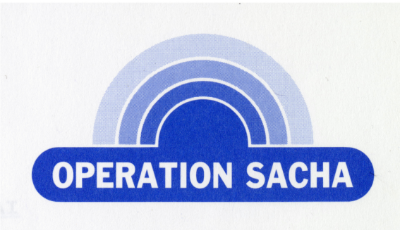
Logo de lancement de l'opération SaCha

Les PDG hésitent. Sanitech ? Le nom existe déjà et risque de porter à confusion. Sanicentral ? Il y a un problème de droits. Ils optent finalement pour "Sacha". Est-ce par amour pour le prénom ? C'est plutôt parce qu'il est court, facile à mémoriser, et parce qu'il symbolise parfaitement la nature des entreprises concernées. En effet, SANitaire et CHAuffage, cela donne... Sacha !