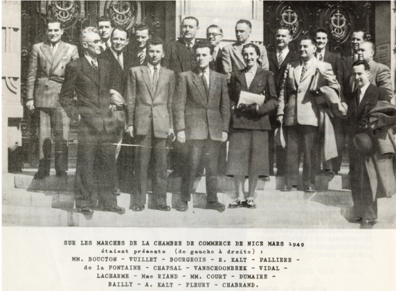
Portrait de groupe des agents d'ISOVER pour les régions Est et Sud-Est à la Chambre de commerce de Nice, 1949

Au même moment , le célèbre architecte Le Corbusier planche sur la construction de tout nouveaux logements à Marseille. Et il prévoit d'utiliser lui aussi des matériaux ISOVER. Pourquoi donc ? On ne vous en dit pas plus, et on vous laisse (re)découvrir notre newsletter d'octobre dernier sur le sujet !