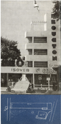
Stand équipé d'une salle de cinéma capitonnée du feutre IBR d'ISOVER, 1949