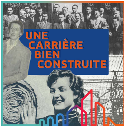
"Une carrière bien construite", un podcast Saint-Gobain Archives à partir de mars 2022