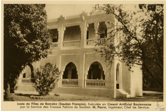
Carte postale Poliet & Chausson, école de filles de Bamako

Ce support est particulièrement bien trouvé. D'abord parce qu'il est très peu cher. Ensuite, parce que l'entreprise fait d'une pierre deux coups : elle promeut ses produits à travers de jolis clichés et fournit directement un moyen pour le client de procéder à l'achat. Celui-ci n'a qu'à remplir quelques informations sur le carton et l'expédier. Simple comme bonjour.