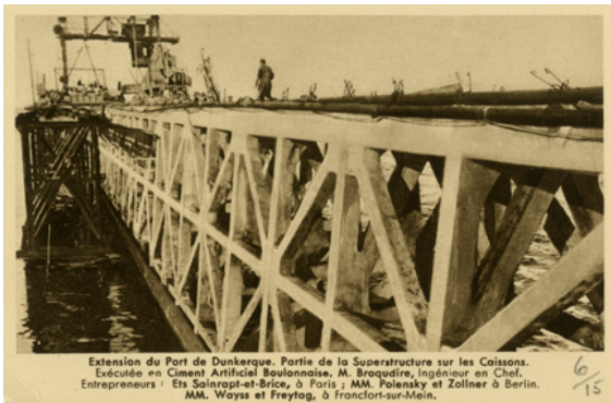
Carte postale Poliet & Chausson, extension du port de Dunkerque

L'entreprise a en effet décidé d'éditer en masse... des cartes postales. Dessus figurent de belles photographies de leurs réalisations : des ponts (la passerelle d'Étaples, le pont Lafayette à la gare de l'Est), des charpentes (l'église de Villeneuve-la-Garenne) ou encore des ports (l'extension du port de Dunkerque).