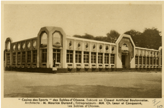
Carte postale Poliet & Chausson, casino des sports des Sables-d'Olonne

1932. L'agent commercial d'une entreprise de construction examine une carte postale qu'il vient de recevoir. On y voit un édifice qui invite au voyage : le Grand Casino des Sables d'Olonne. Après avoir observé l'objet un moment, voilà notre homme qui griffonne au recto avec enthousiasme avant de le glisser dans une boîte aux lettres. S'agit-il d'une correspondance romantique ? De nouvelles d'un cousin, d'un ami ?