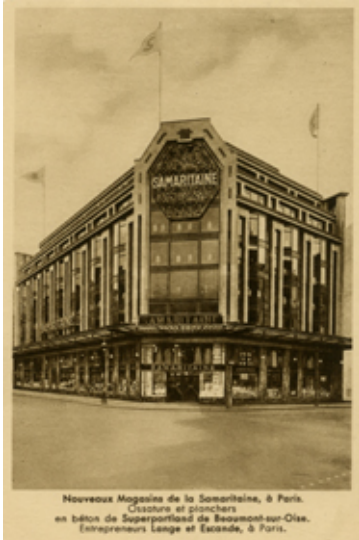
Carte postale Poliet & Chausson, magasin de la Samaritaine à Paris

D'autant qu'à l'époque , ce moyen de communication est d'une rapidité imbattable : les cartes peuvent être distribuées jusqu'à cinq fois par jour dans les grandes villes. Presque aussi efficace qu'un mail ou un MMS finalement... En permettant de commander des matériaux à distance si vite et si facilement, Poliet & Chausson développe une sorte de e-commerce avant l'heure. Une idée qui n'est pas restée lettre morte !