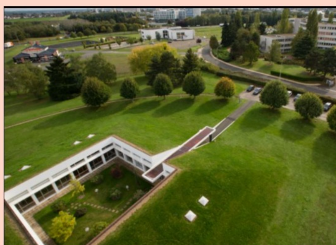
Le site de Blois

Cet écopâturage, initié en partenariat avec la société Greensheep dans le cadre du programme "Agir durablement" , s'étendra sur une partie de 3 hectares du parc, le reste de l'espace étant entretenu par l'Esat des Papillons Blancs depuis bientôt 10 ans. Un pas de plus pour préserver cet espace protégé par la Ligue de protection des oiseaux !