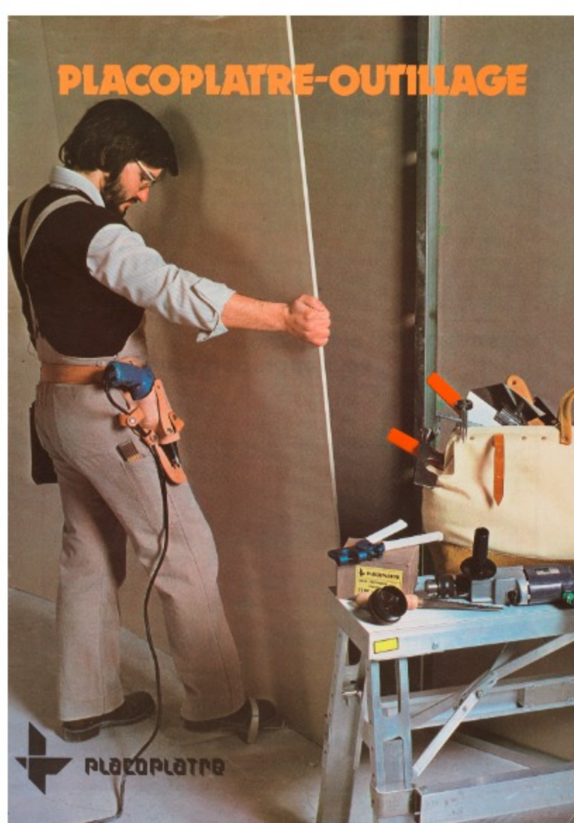
Catalogue Placoplatre-Outillage, avril 1979