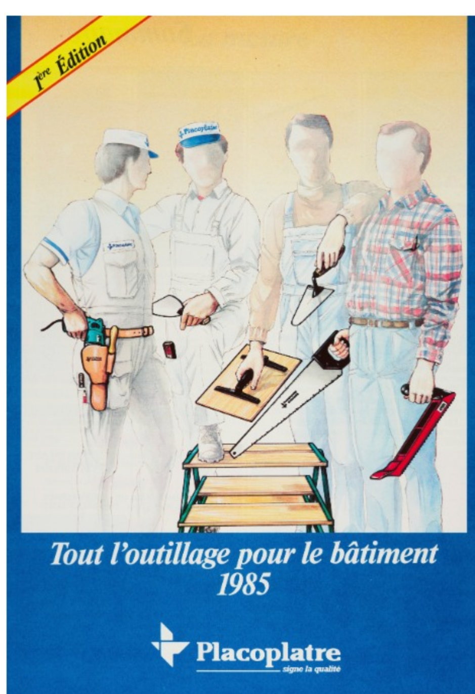
Catalogue de produits Placoplatre, Tout l'outillage pour le bâtiment, édition 1985

Et en 2005, Saint-Gobain accueille en son sein les plaquistes, leurs échasses et leurs banjos : Placoplatre rejoint le Groupe !