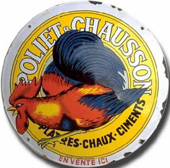
Logo de Poliet & Chausson

Baptisés Point.P (P comme Poliet bien sûr !), les points de vente s’adresseront à la fois aux artisans et aux particuliers pour répondre au boom de la maison individuelle. Mais comment rendre visible cette petite révolution auprès du grand public ?