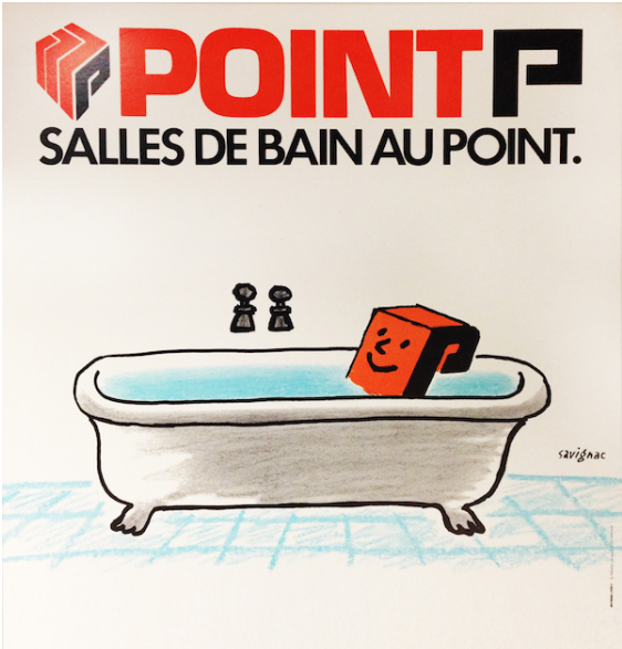
Affiche publicitaire de Raymond Savignac pour Point.P, 1982. © Raymond Savignac, 1982 © ADAGP, 2018 / Saint-Gobain Distribution Bâtiment France