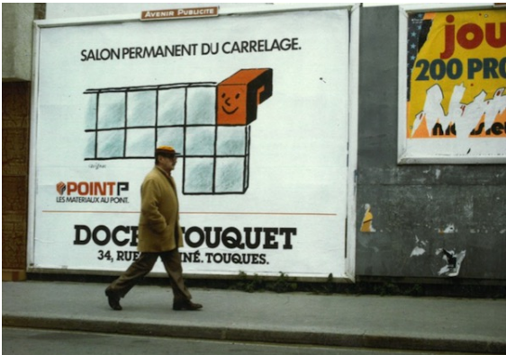
Raymond Savignac passe incognito devant l’une de ses affiches publicitaires pour Point.P près de chez lui à Trouville (Calvados), 1982.

Et pour la puissante campagne d’affichage, on fait tout simplement appel à l’un des plus grands affichistes français, Savignac.