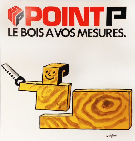
Affiche publicitaire de Raymond Savignac pour Point.P, 1982. © Raymond Savignac, 1982 © ADAGP, 2018 / Saint-Gobain Distribution Bâtiment France

Après la lettre P , place à 3 autres consonnes : B-n-F !