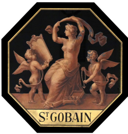
La marmorite utilisée comme enseigne de la glacerie de Franière (Belgique) créée en 1898 (verre noir opaque)

Ces deux pièces prestigieuses sont de superbes exemples de ce fameux logo de la dame au miroir, qui va rester en vigueur jusqu'en 1970 !