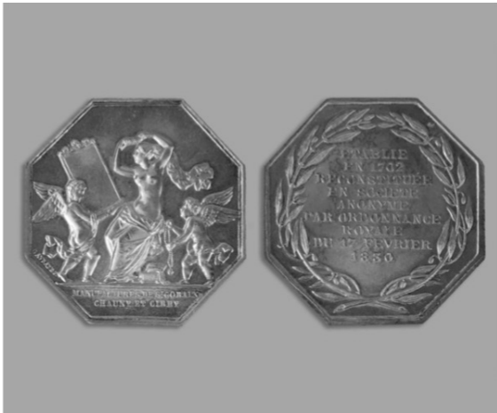
Jeton de présence en argent de la Manufacture royale des glaces à l'effigie de la dame au miroir destiné à la rémunération des administrateurs de la Compagnie, 1858 Grav. Gayrarde

Ce motif apparaît dès les années 1830 sur des jetons de présence distribués aux administrateurs. On le retrouve ensuite sur les étiquettes des produits de l'entreprise, et ce jusqu'aux années 1970.