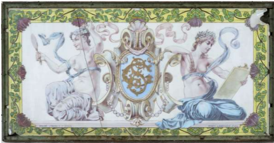
Hubert et Martineau, Opaline de Saint-Gobain peinte au motif de la Dame au miroir, 1900

Il s'agit d'une grande plaque de verre de couleur blanche représentant deux dames, de part et d'autre des lettres "SG"... comme Saint-Gobain !