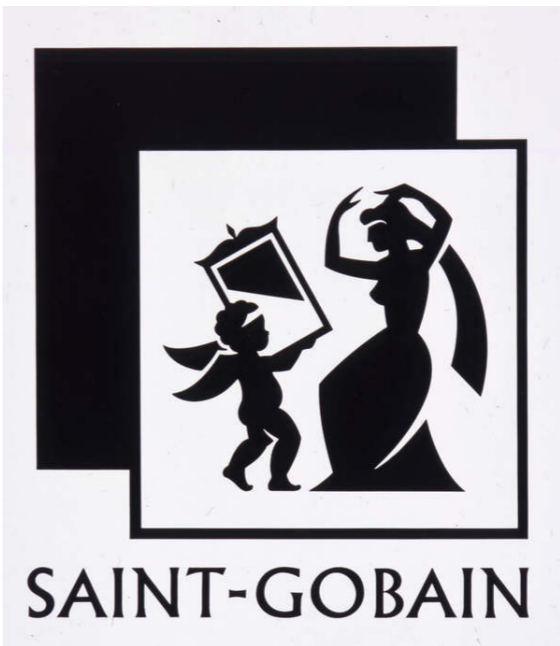
Logo de la dame au miroir vers 1960

Sur la nouvelle identité visuelle de Saint-Gobain