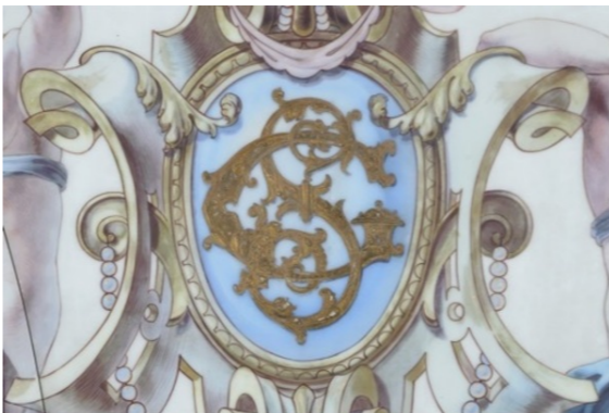
Hubert et Martineau, Opaline de Saint-Gobain peinte au motif de la Dame au miroir, 1900, Détail

On en met sur les murs ou les tables, c'est moins cher que le marbre et bien plus pratique à nettoyer !