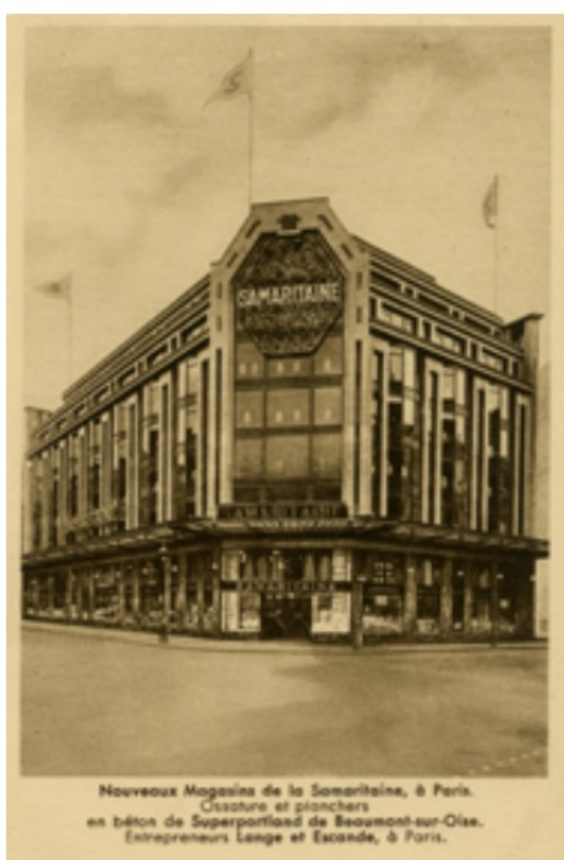
"Nouveaux Magasins de la Samaritaine à Paris" : carte postale publicitaire de Poliet et Chausson, vers 1930

Cette année-là, un des magasins aura donc droit à une façade flambant neuve, à la pointe de la modernité ! Pour accomplir la mission, on fait appel à un nouvel architecte. Ce dénommé Henri Sauvage promeut un courant en plein essor : l'Art déco, tout en lignes géométriques. Et qui dit nouvelle esthétique, dit nouveau matériau.