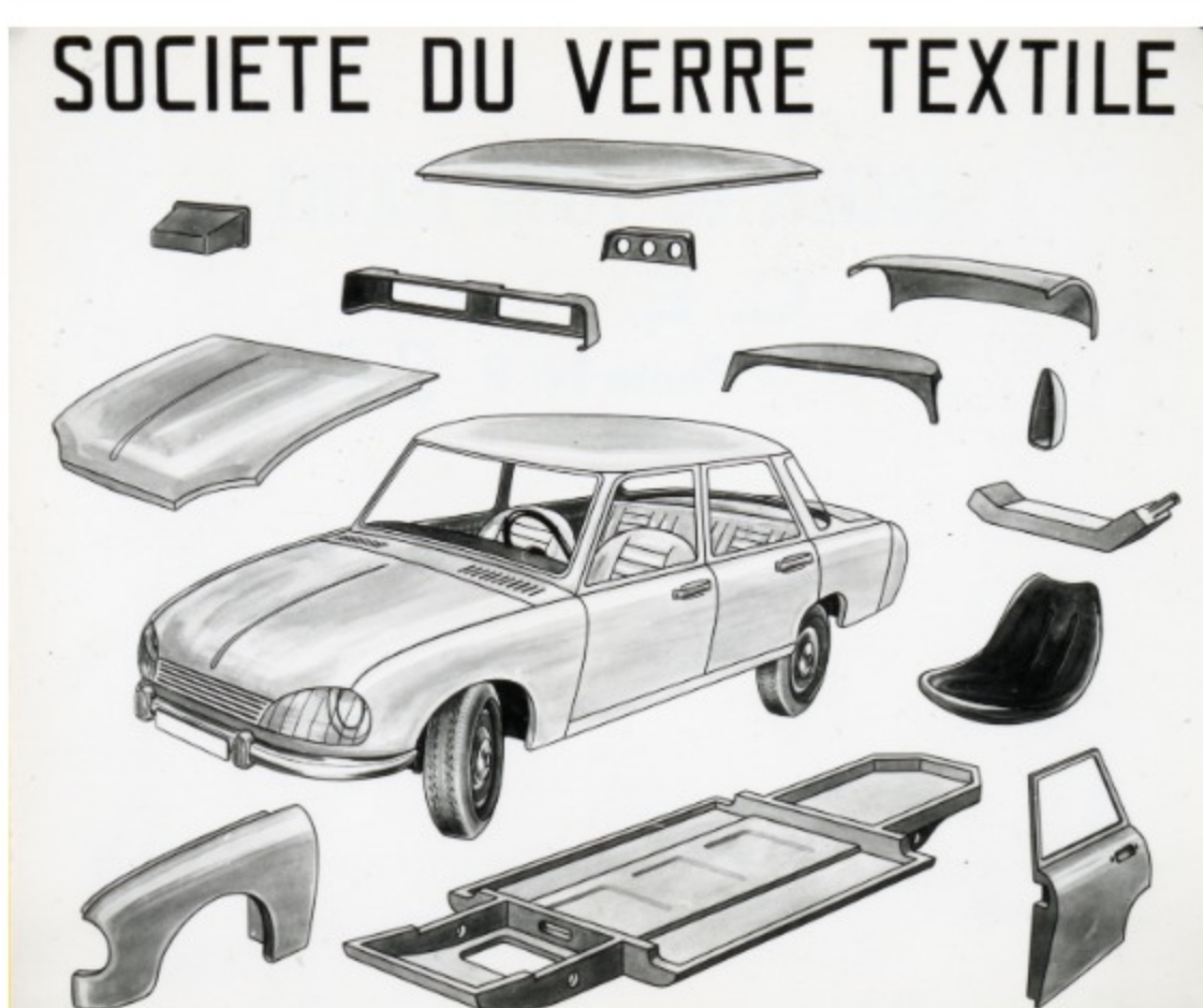
Éléments de la DS 19 en fibre de verre

La DS est en effet un véritable concentré d'innovations techniques. Un petit exemple : son pare-brise, signé Saint-Gobain. En plus d'offrir une exceptionnelle visibilité du fait de sa surface, il présente l'originalité d'être galbé ! Ce verre courbe participe à l'aérodynamisme exceptionnel de l'automobile.