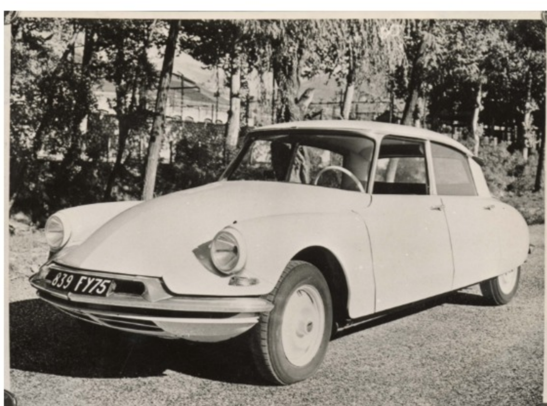
DS 19

Alliant le confort à la sécurité , tout en arborant un design ultra moderne séduisant, la DS 19 devient immédiatement la star du salon. La preuve : on compte 750 commandes une heure seulement après sa présentation et 1 200 à la fin de la journée. Charles de Gaulle lui-même ne tarde pas à en faire le véhicule présidentiel. Un démarrage au quart de tour qui n'a pas été démenti par le temps, puisque ce modèle iconique continue à inspirer les designers !