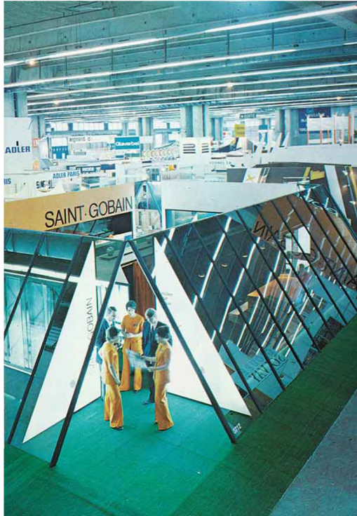
Stand Saint-Gobain à Batimat dessiné par R. Tallon, 1971

En effet, les lumières du salon se répercutent sur un verre réfléchissant d'un nouveau genre : le Parello. Il vient tout juste d'être mis au point par Saint-Gobain. Impossible de le manquer ! Mais qui a eu cette idée lumineuse ?