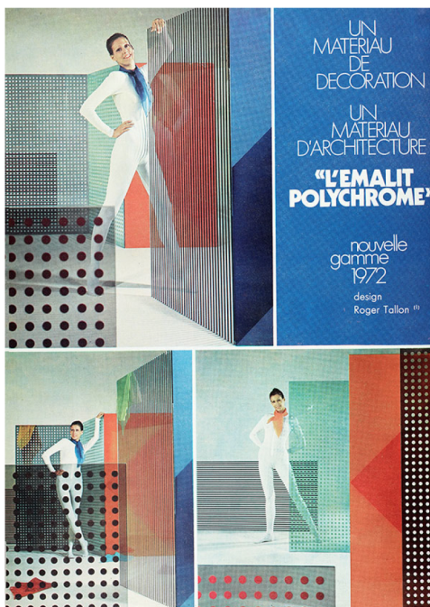
Publicité présentant la nouvelle gamme d'Emalit Polychrome par R. Tallon, 1972