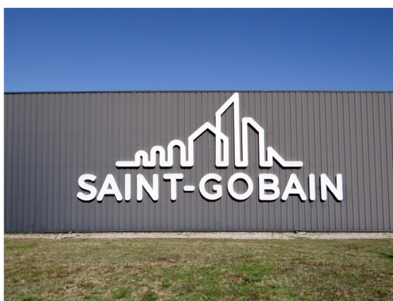
Enseigne rénovée de l'ancien siège social de Saint-Gobain à la Défense, les Miroirs

À l'occasion de la journée Agir durablement , Saint-Gobain Archives marque son engagement pour une seconde vie des matériaux : le Groupe redonne vie à l'enseigne de l'ancien siège social des Miroirs. Elle nous permet d'affirmer avec fierté notre identité pluriséculaire. L'enseigne est bien visible sur la façade d'un de nos bâtiments jusqu'à la tombée du jour. Nous avons choisi de ne pas l'illuminer la nuit, par économie d'énergie et pour offrir à la faune de notre parc (230e site protégé de la LPO en France !) une obscurité maximale.