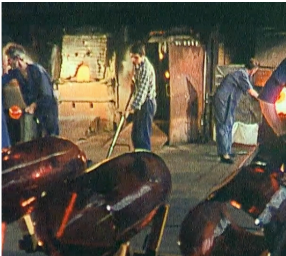
Soufflage du verre à la verrerie de Saint-Just-Sur-Loire, 1971

Avec un grand talent, Lardeur utilise les milliers de nuances de verre produites par la verrerie de Saint-Just, filiale de Saint-Gobain, pour créer de véritables tableaux. Il raconte : "J'ai l'impression de travailler avec une matière irréelle : non avec du verre, mais avec de la lumière colorée..."