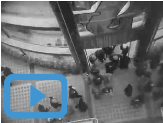
Visite filmée du pavillon de Saint-Gobain à l'Exposition internationale de Paris, 1937, copyright Saint-Gobain

Mais une fois l'exposition terminée, le pavillon est entièrement démoli. À part des photos, quelques documents et des films, il n'en reste rien... Vraiment ?