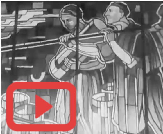
Vue du vitrail lors de la visite filmée du pavillon de Saint-Gobain à l'Exposition internationale de Paris, 1937

Pendant des décennies, on ignore où se trouve le fameux vitrail !