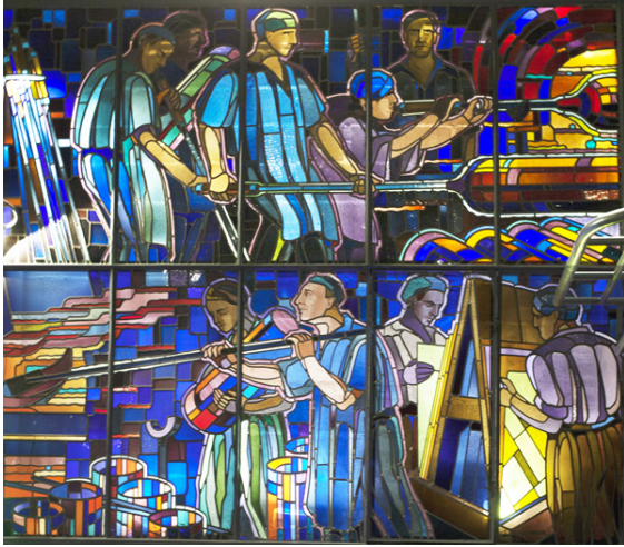
Le vitrail de Lardeur pour le pavillon de Saint-Gobain

Sur le soufflage du verre à la verrerie de Saint-Just