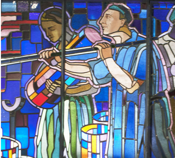
Détail du vitrail de Lardeur pour le pavillon de Saint-Gobain

Deux nièces de Raphaël Lardeur ainsi que deux de ses petit-fils seront même présents pour lui rendre hommage. Il n'aurait sans doute pas imaginé une telle épopée pour son vitrail !