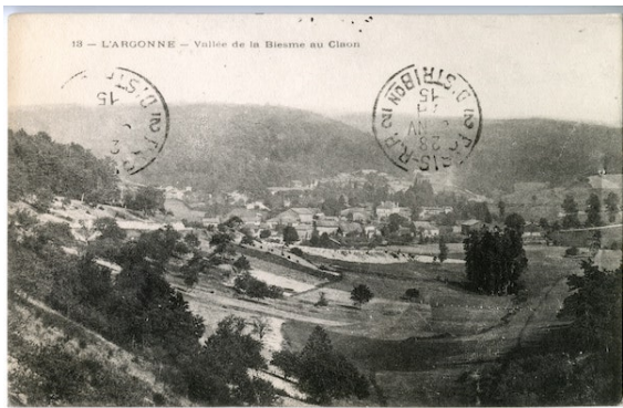
Carte postale de l'Argonne, vallée de la Biesme au Claon, 26 janvier 1915, envoyée à Comberousse par un soldat au front

Les cartes, couvertes de mots réconfortants, viennent de partout. Tous les employés en profitent pour lui donner des nouvelles : certains sont au front, d'autres mobilisés dans les usines de guerre, d'autres encore faits prisonniers.