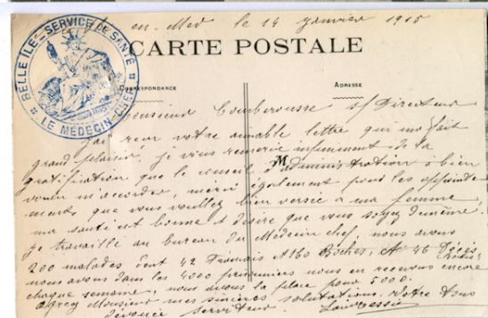
Carte de Belle-Isle-en-Mer, défilé de prisonniers Allemands, 14 janvier 1915, envoyée à Comberousse par un employé au bureau du médecin-chef

Il y a donc "l'esprit maison », mais aussi l'esprit novateur et bâtisseur de Saint-Gobain ! Pour s'en rendre compte, direction l'exposition " L'art du chantier. Construire et démolir du 16 e au 21 e siècle " à la Cité de l'architecture et du patrimoine à Paris.