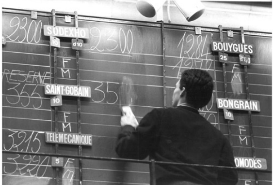
Photographie d'une cotation boursière, 1986, © Sipa Press, photo Chesnot / Archives de Saint-Gobain

Et ce message de démocratisation fonctionne au-delà de toutes les espérances : plus d'un million de nouveaux actionnaires viennent de catégories sociales bien plus diverses. Par exemple, 6% des actions sont détenues par le personnel et les retraités de l'entreprise elle-même !