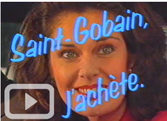
Extrait du spot publicitaire de Publicis pour la privatisation de Saint-Gobain: "Les arches du désert", 1986, Spot TV

Dans les années 1980, les Français voient fleurir sur leurs écrans de télévision de courts spots publicitaires. On y découvre des personnes de tous les âges affirmer avec assurance leur confiance dans l'entreprise Saint-Gobain : mieux, tous sont prêts à acheter des actions ! Cette campagne publicitaire, conçue par Publicis, est absolument sans précédent. Elle est l'écho d'un événement crucial de la vie de l'entreprise Saint-Gobain : sa privatisation en 1986.