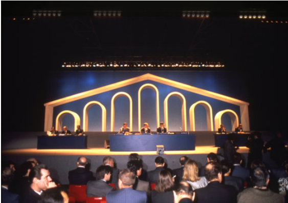
Photographie de l'AG au Zénith de Paris

La Revue française d'histoire économique vient de consacrer son dernier numéro (2016-2) à « Saint-Gobain 350 ans. Histoire et mémoire de l'entreprise ».