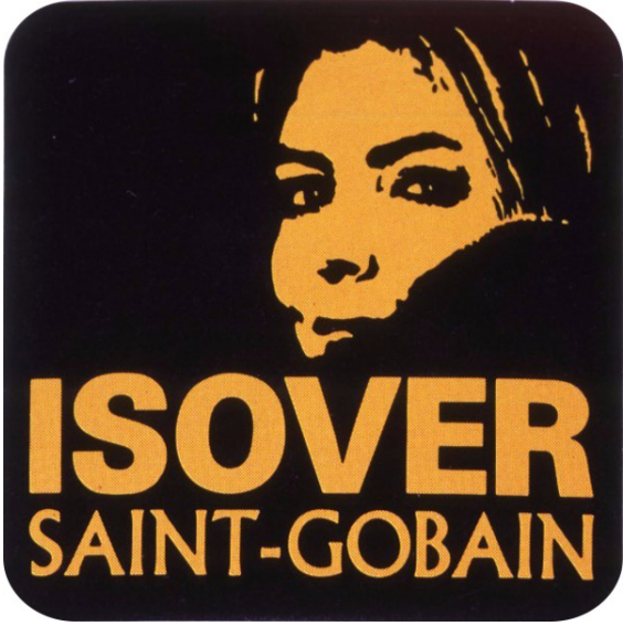
Le logo Erika d'Isover Saint-Gobain, 1970, copyright Saint-Gobain

Grâce à elle, on peut calculer simplement quelle épaisseur d'isolant thermique est la plus rentable pour le client. Jusque-là, il fallait se lancer dans des calculs horriblement compliqués... Mais comment faire comprendre à tous l'intérêt de cette innovation ?