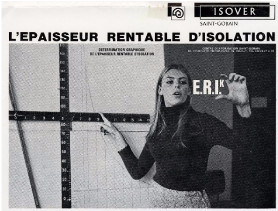
Erika d'Isover : "Plus qu'une femme, une formule... L'épaisseur rentable d'isolation", 1969, détail

La formule a déjà un nom, l'E.R.I., pour "épaisseur rentable d'isolation". Et si on lui ajoute la lettre "k", qui correspond au "coefficient de transmission thermique", cela donne... Erika.