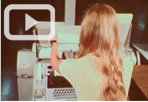
Image extraite de la campagne Erika d'Isover, 1970

Le succès est au rendez-vous ! Pour faire face à la demande, Isover met au point un programme informatique pour traiter des dizaines de requêtes simultanément. C'est une révolution : l'informatique balbutiante appliquée au marketing ! "Que vous soyez dix ou cent à l'interroger ensemble, Erika vous répondra sans perdre ni une seconde ni son contrôle", promet la publicité.