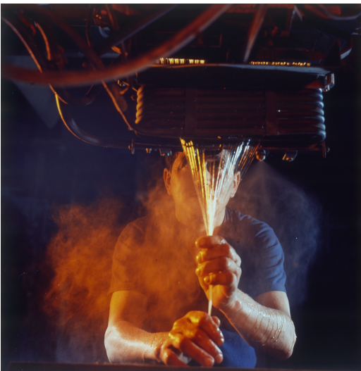
Fabrication du fil de verre à l'usine Vetrotex de Chambéry : étirage du fil par un ouvrier en sortie de filière

Du feutre de fibre de verre est imprégné de résine : c'est ce qu'on appelle le Fiberglass. Il est ensuite placé dans un moule à la forme du ski et, en une seule opération, chauffé et compressé contre les parois grâce à de l'air comprimé.