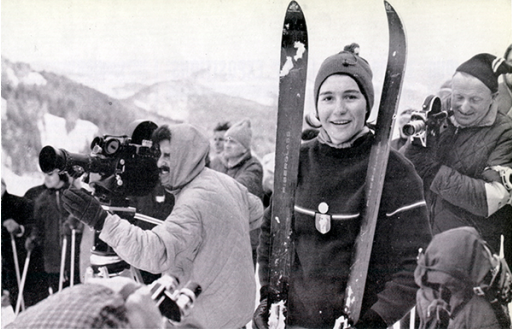
Marielle Goitschel, championne du monde de combiné alpin en 1962 à Chamonix

1962. La jeune skieuse Marielle Goitschel remporte haut la main le titre de championne du monde de combiné alpin. Le tout à seulement 16 ans ! Fièrement, elle pose avec sa paire de skis Rossignol. Ces derniers sont très particuliers : ils sont... en verre !