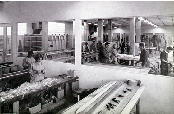
Fabrication des skis dans les ateliers des Etablissements Rossignol à Voiron dans les années 1960

Jusque-là, les skis étaient en bois. Quelques rares prototypes en métal venaient également de faire leur apparition. Mais ces derniers étaient lourds et peu maniables.