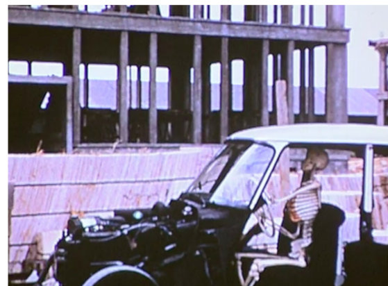
Les os et la peau, 1960 © Réal. Jean-Louis Gobaille / Voix Jean Rigaux / DR / Archives de Saint-Gobain

Et pour couronner le tout, le conducteur est... un squelette ! Serait-on dans un film policier ? Eh non ! Il s'agit en réalité d'un film Saint-Gobain destiné à des architectes et des entrepreneurs.