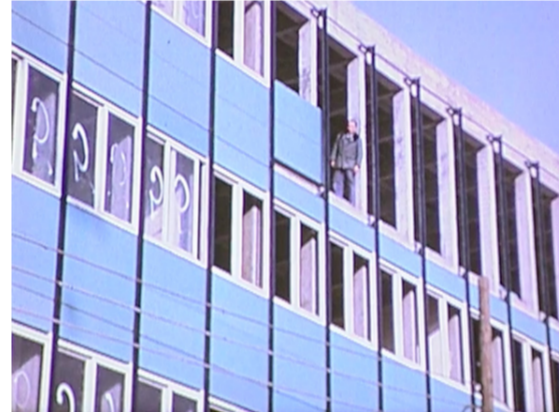
Les os et la peau, 1960 © Réal. Jean-Louis Gobaille / Voix Jean Rigaux / DR / Archives de Saint-Gobain

Dans cette période de reconstruction d'après-guerre, il faut bâtir vite et bien. Saint-Gobain crée avec Marcel Lods et la société de l'Aluminium français un Groupement pour l'Etude d'une Architecture Industrialisée (GEAI). Il s'agit de réfléchir à de nouvelles méthodes de construction.